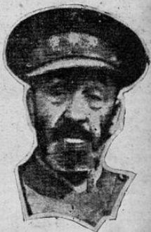
ha vivido España la más gloriosa acción de los nuevos siglos.

CON LOS LEALES EN EL FRENTE NORTE. SANTANDER. 6.—Los chadores de Oviedo lanzaron un intrépido asalto contra las fortificaciones de los defensores del coronel Aranda, capturaron varios edificios entre la estación de ferrocarril del norte y la penitencinaria, los que habían sido convertidos en verdaderas fortalezas por la guarnición. Los mineros destruyeron varias casas de donde se les tiraba con efecto mortífero, causando muchas bajas en las filas, de los sitiados y apoderándose de mucho material de guerra.